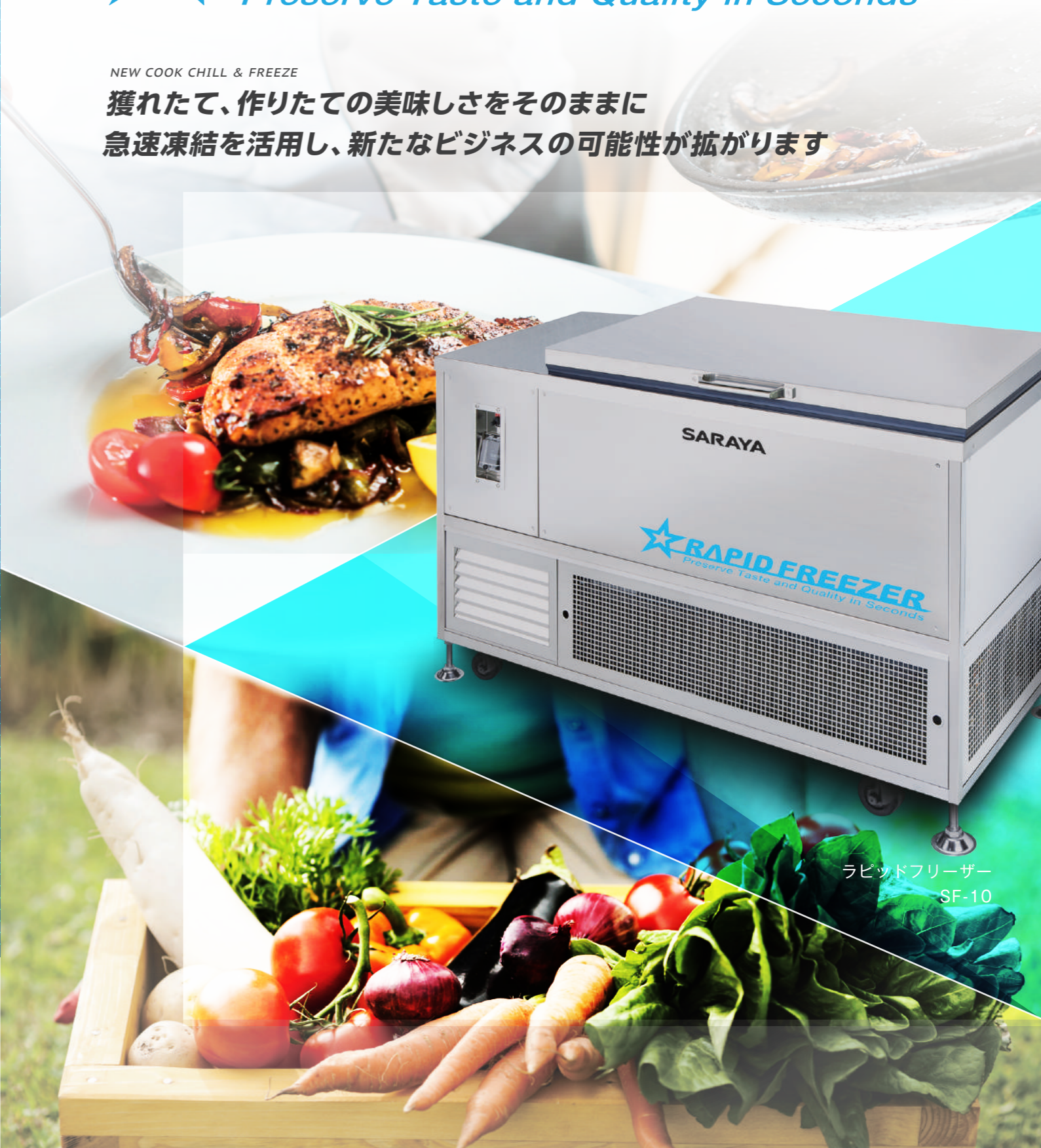
ラピッドフリーザー SF-10

獲れたて、作りたての美味しさをそのままに 急速凍結を活用し、新たなビジネスの可能性が広がります