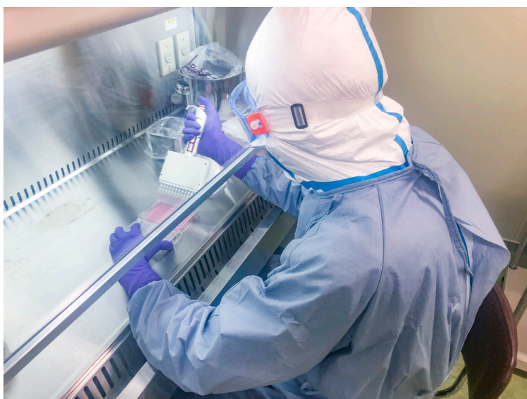
新型コロナウイルスに対する評価試験を行う研究員