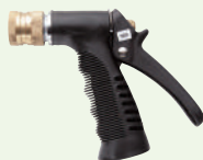
すすぎ用トリガースズル

本仕様は性能向上のため、予告なく変更されることがありますのでご了承ください。 ※使用薬液は、当社指定の薬液をお使いください。他社の薬液を使用した場合、トラブルが生じる恐れがありますのでお使いにならないでください。