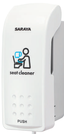
MD-300B-PHJ 便座クリーナー用