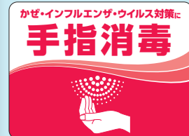
手指消毒啓発パネル