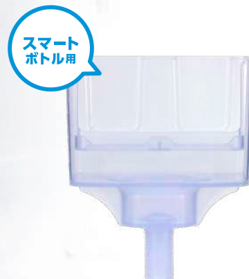
手洗いボトルセットホルダー スマートボトル用