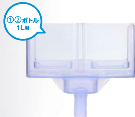
手洗いボトルセットホルダー ①②ボトル1L用