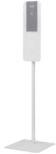
手指消毒用マルチスタンド MS-02-W スタンド型