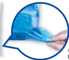
手首部分からも 取り出せます!