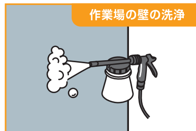
作業場の壁の洗浄