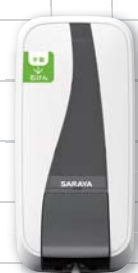
MD-450-GL 容量:450mL 商品コード 41877 W105×D88×H224mm