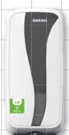
UD-450-GL 容量:450mL 商品コード 41881 W105×D99×H225mm