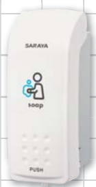
MD-300S-PHJ 容量:250mL 商品コード 41936 W79×D99×H203mm