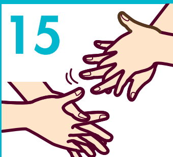
15 手の平と甲指の間にすり込む