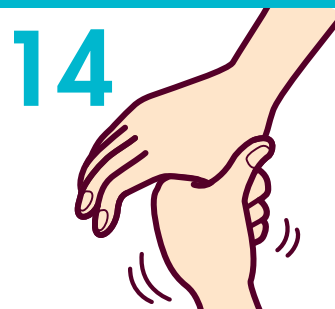
14 親指の付け根まですり込む