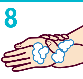
8 手首を洗う (5回程度)