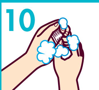
10 爪ブラシで爪の間を洗う