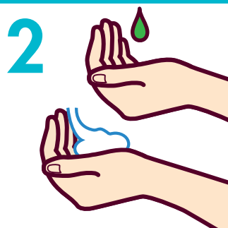
2 手洗い用石けん液をつける