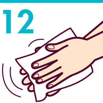
12 ペーパータオルでふく