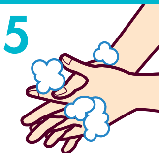
5 指の間を洗う (5回程度)