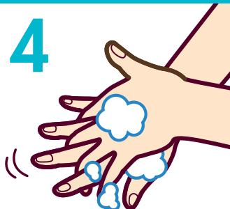
4 手の平と甲を洗う (5回程度)