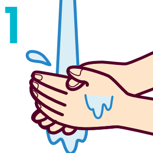
1 流水で軽く手を洗う