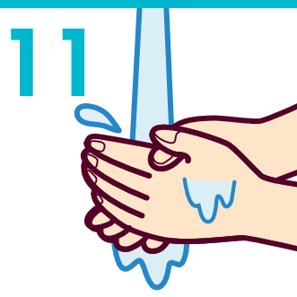
11 流水でよくすすぐ (15秒程度)