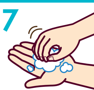
7 指先を洗う (5回程度)