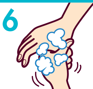
6 親指の付け根まで洗う (5回程度)