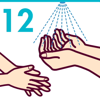
消毒剤をすり込む