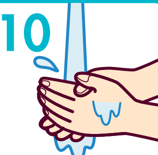
流水でよくすすぐ