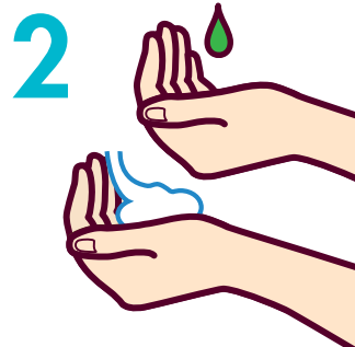
石けん液を適量とる