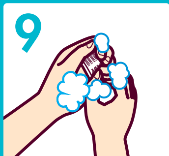
つまみブラシ(両手)